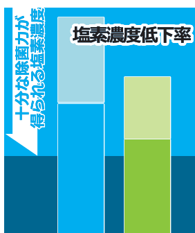
ESS・LESシリーズ 50~60mg/kg ◎除菌・手洗いシリーズ 20~30mg/kg